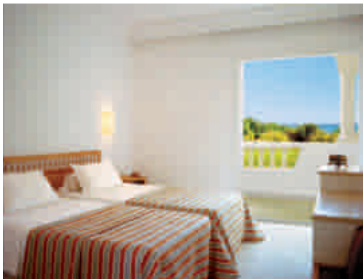
Camera standard con vista mare