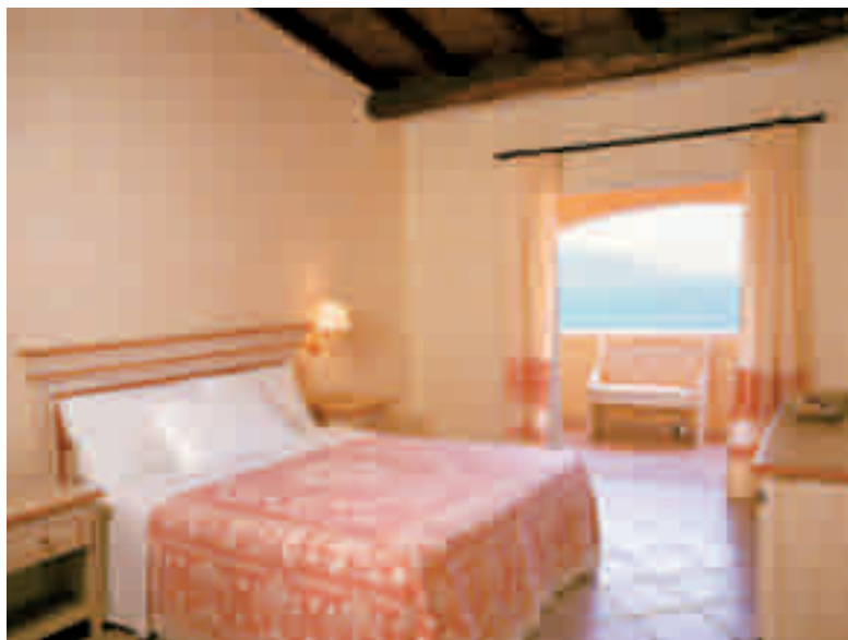
Camera Beach Hotel vista mare